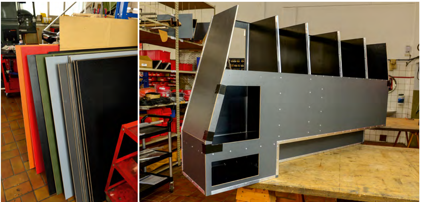
Bunte Palette: Knalliges Orange oder doch lieber dezentes Grau? Der Kunde kann für die Hesch-Einbauten zwischen verschiedenen Farben wählen.